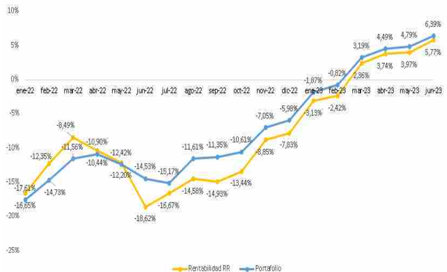
Rentabilidad Benchmark vs Rentabilidad del Portafolio

En la reunión de Asamblea 2024, presentaremos los datos a diciembre 2023.